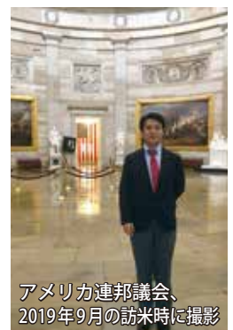
アメリカ連邦議会、 2019年9月の訪米時に撮影

9月12日～14日にアメリカ・ワシントンD.C.で開催される国際議員連盟のIPAC (Inter-Parliamentary Alliance on China) 総会に桜井シュウは参加します。戦後の世界秩序は基本的人権、民主主義、法の支配、市場経済などの人類の普遍的価値に基づいて形成されてきましたが、昨今は中国が専制主義と国家資本主義で世界を席捲しようとしています。桜井シュウは、各国の国会議員と連携して、人権と民主主義等の普遍的価値を守り広める活動を展開しています。それにより、世界の市民の幸せな暮らしを追求していきます。