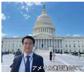
アメリカ連邦議会にて

3日間の協議を経て、中国政府が主導する一帯一路に代わる資金供給メカニズムの強化、ウイグルでの強制労働を含めて人権侵害による製品をサプライチェーンから排除、香港の自治と自由の復活に向けて香港市民との連帯、台湾の民主主義を守るため台湾との外交的・経済的関係の強化、ウクライナ支援のためロシアと関係する企業への制裁実施など18項目を共同声明としてとりまとめました。