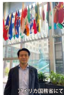
アメリカ国務省にて

※マグニツキー法=国際人権法に定める人権を著しく侵害する行為に関与した者(個人・企業)に対し制裁を科す法律。日本以外のG7各国では制定済。