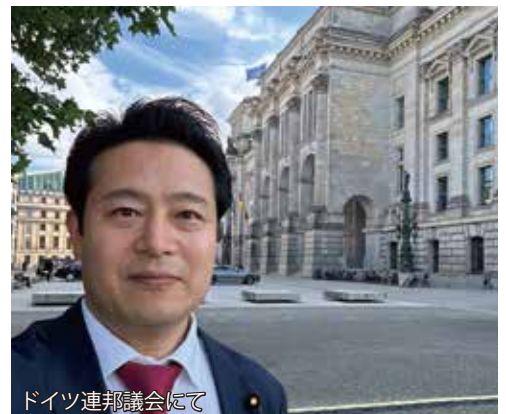
ドイツ連邦議会にて

ドイツも日本も安全保障政策にはアメリカとの同盟が必要不可欠。したがって、アメリカがヨーロッパとアジアに関心を持ち続けるような努力が必要との認識を共有しました。