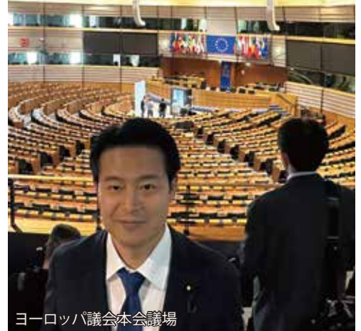
ヨーロッパ議会本会議場

東西冷戦時代には東西の経済交流はほとんどなかったが、今は多くの国において中国が最大の貿易相手国となっています。中国との経済関係を断絶(decoupling)は困難であるものの、リスク軽減(de-risking)に努めるべきとの認識を共有しました。