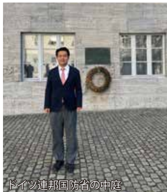
ドイツ連邦国防省の中庭

敗戦後に東西ドイツは再軍備を禁止されたものの、東西冷戦の中で西ドイツも再軍備。ただし、ナチスとの断絶を明確にするために旧ドイツ軍は継承せず、ナチスに反対した勢力を基盤にしました。これは、ドイツがNATOに加盟する際の、フランスなどナチスに蹂躪された周辺国へのドイツの反省と誠意の現れ、との説明でした。